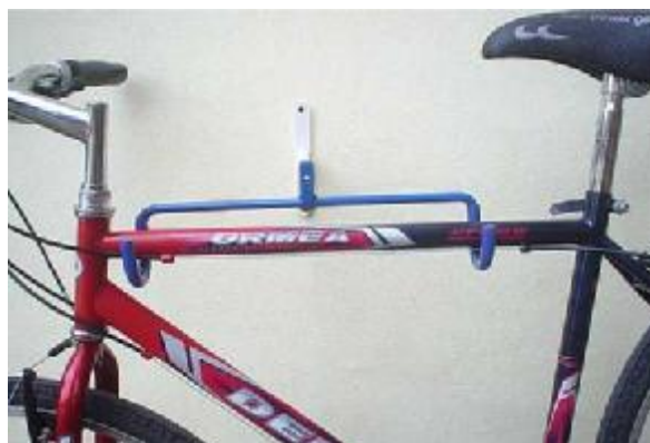
príklad uloženia pánskeho bicykla