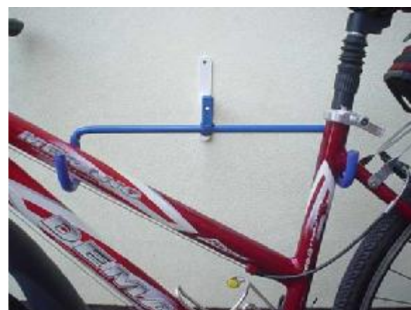
príklad uloženia dámskeho bicykla